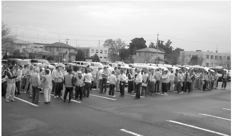
▲市内一斉パトロールのため、市庁舎に集合した全市の青パトの皆さん(2009年10月17日)