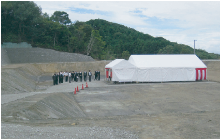
↑豊沢地区に建設される新給食センター(9/3起工式)